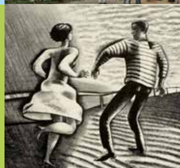
Walter Mattheuer „Paar im Regen“